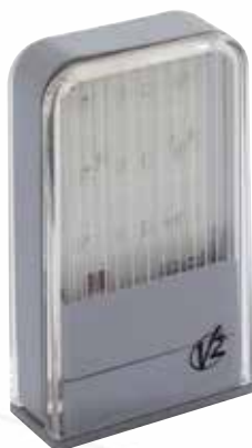
Feu à led Lumos