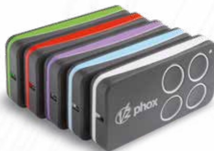
Émetteur radio Phox