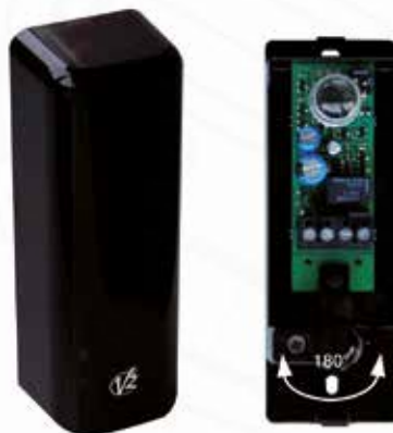
Cellules Sensiva 180