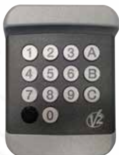
Clavier à code Kibo